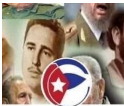
Coordinador Bmc Guyana