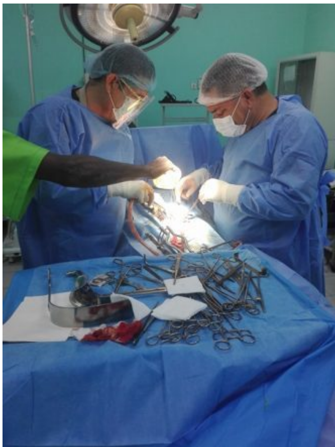
Colaboración cubana en Burkina Faso