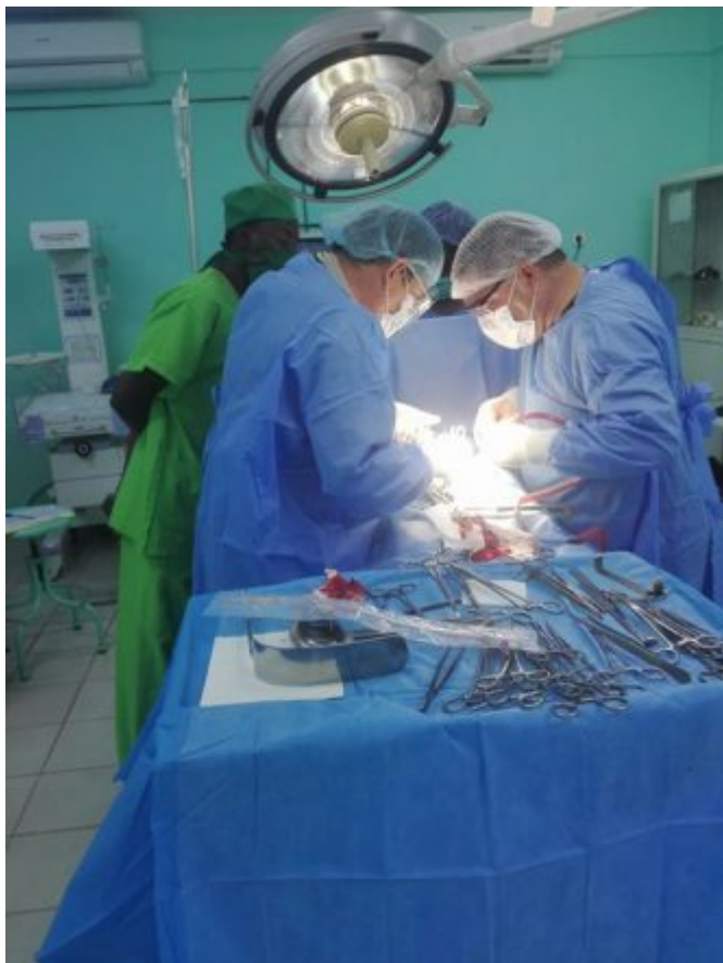
Colaboración cubana en Burkina Faso