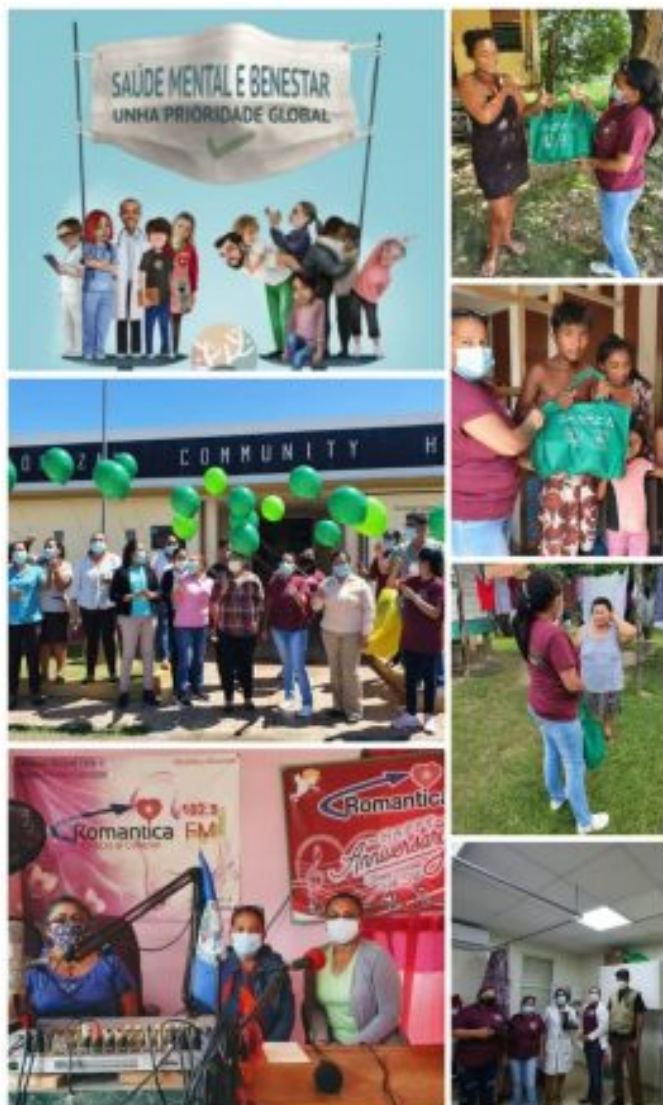
Brigada Médica Cubana en Belice, celebrando el Día Mundial de la Salud Mental

entre una persona y su entorno socio-cultural que garantiza su participación laboral, intelectual y de relaciones para alcanzar un bienestar y calidad de vida.