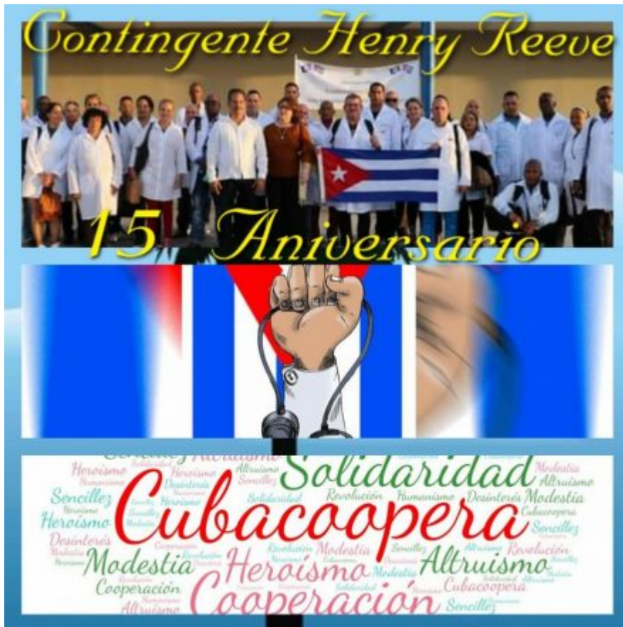
Contingente Henry Reeve

Nada detiene la solidaridad cuando se ha crecido sintiendo amor por la humanidad, cuando sabes que puedes hacer grandes cambios en el mundo con sólo pequeñas obras de amor.