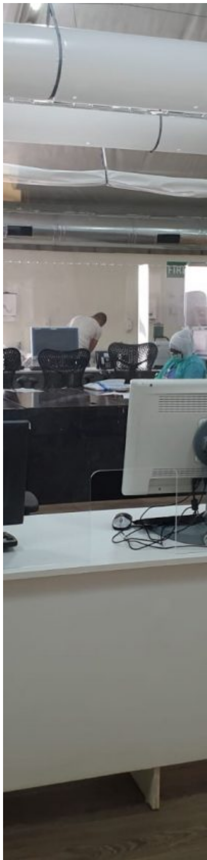
Segunda fase del hospital de campaña en Dukhan