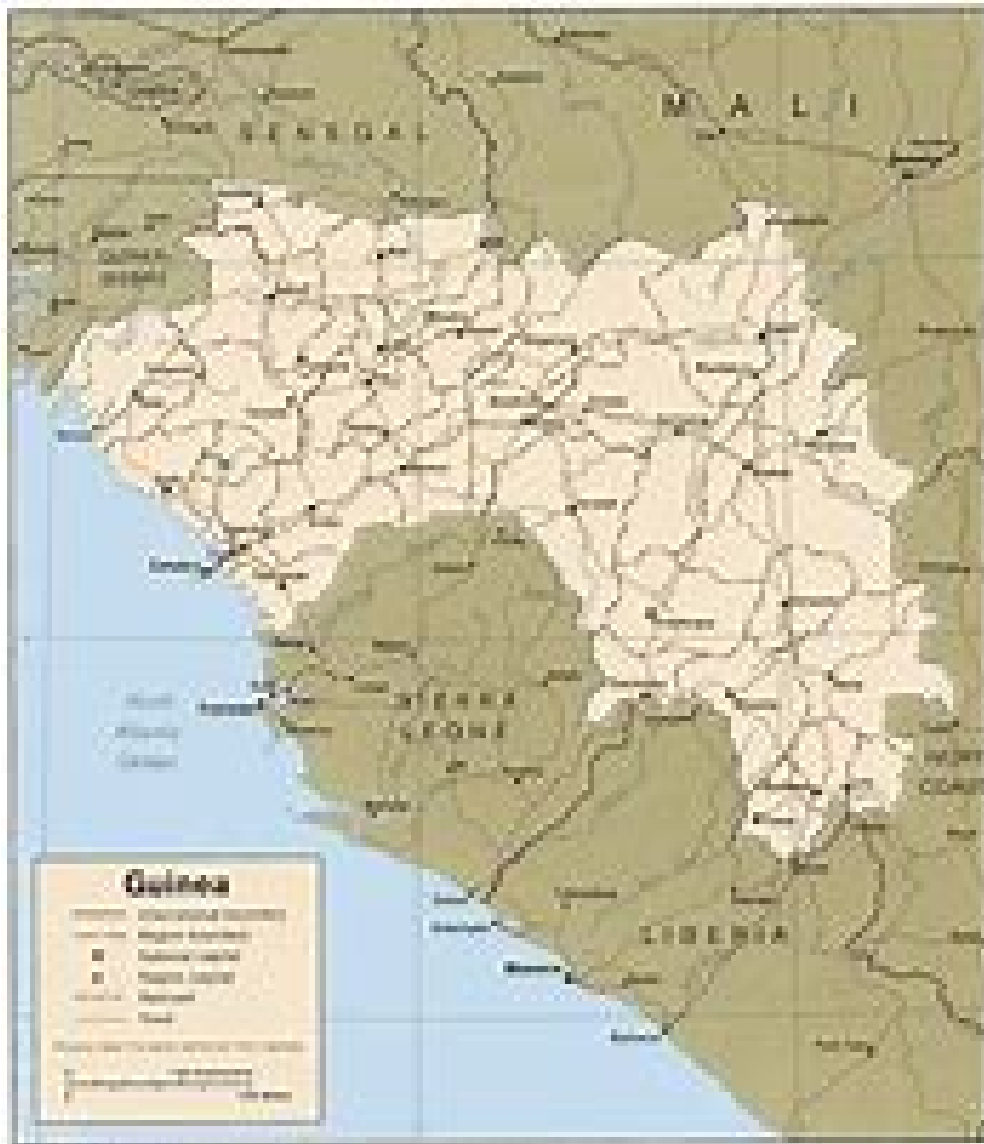
Mapa de Guinea Conakry.