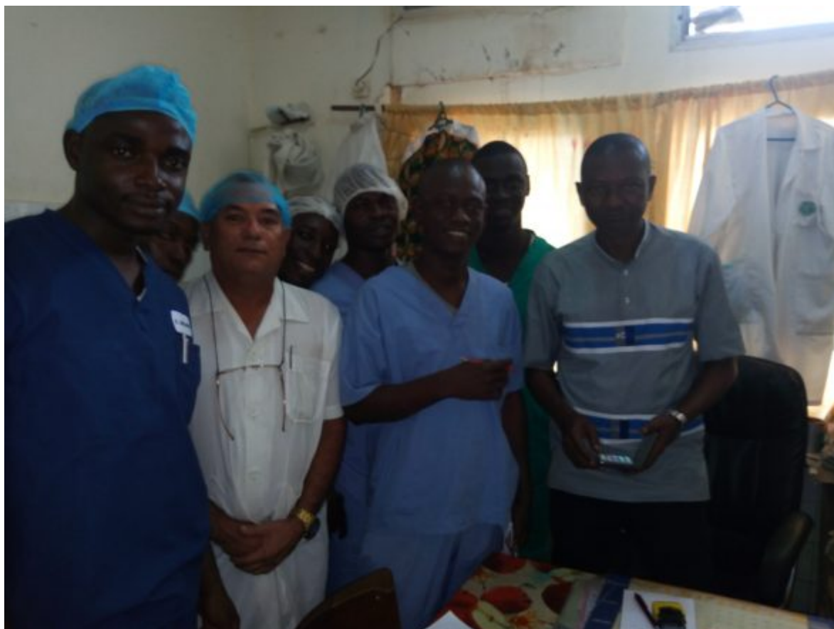
Guinea Conakry, 22 de Agosto del año 2019.