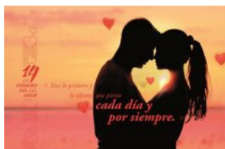
Amor por siempre

Diez nuevas postales de Correos de Cuba dedicadas al Día de los Enamorados, a celebrarse el venidero 14 de febrero, se ofertarán en todos los puntos de venta de La Habana.