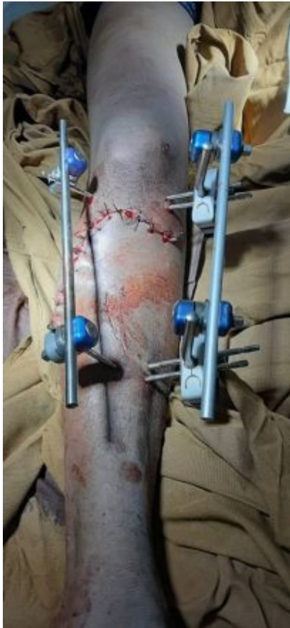
Operacion con los fijadores