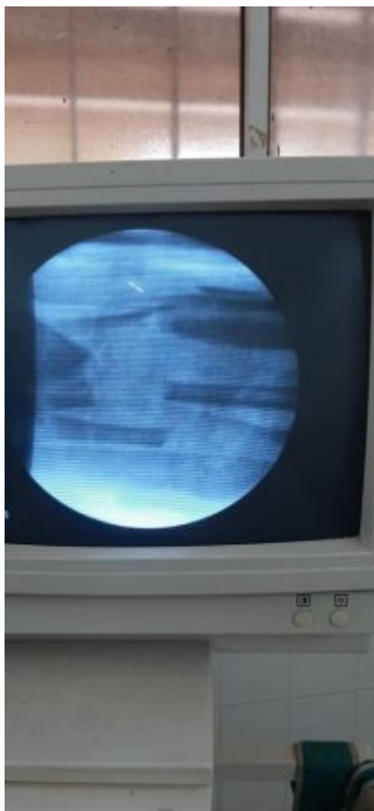
Antes de la operacion

Al examen físico se observa fractura abierta de la tibia derecha, con defecto óseo, pérdida de músculo y piel. Se le realiza radiografía y se corrobora el diagnóstico, por lo que se le realizan complementarios de urgencia. Se lleva al quirófano para tratamiento quirúrgico, se procede a una amplia toilette, se colocan fijadores externos debido al tipo de lesión presente y a la pérdida de sustancia ósea. En estos momentos se encuentra con tratamiento antibiótico endovenoso y osteoclisis.