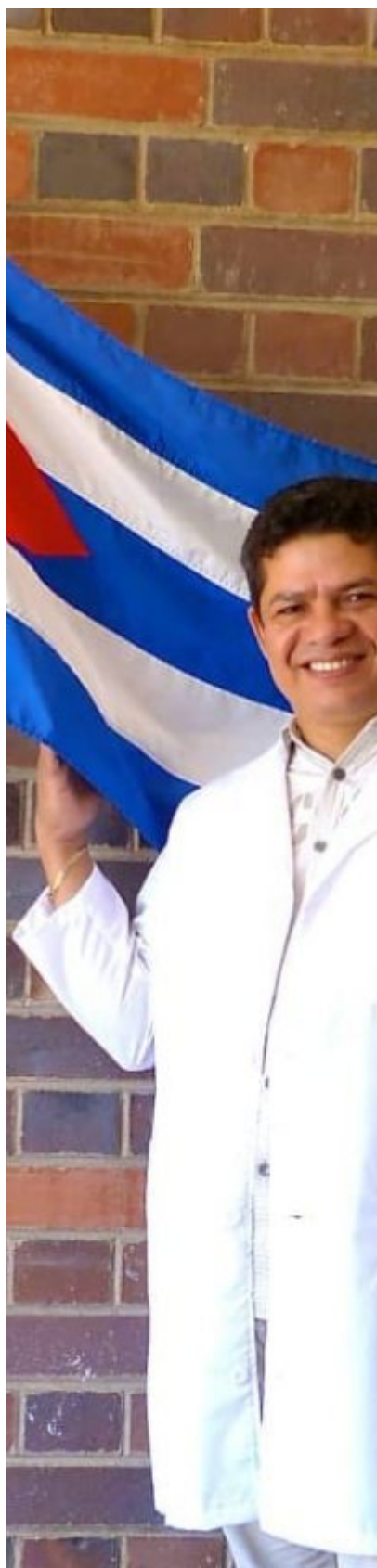
Manos de Ángeles