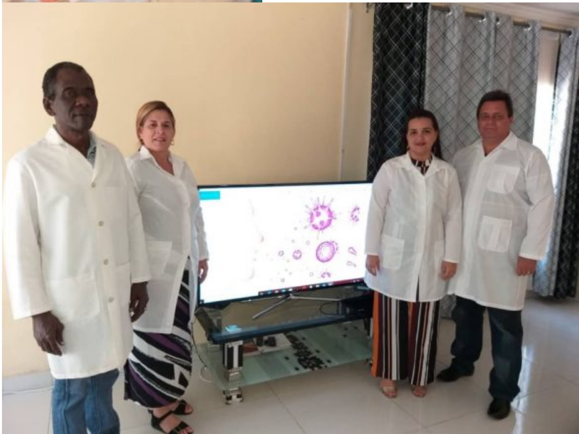
Jornada científicas policlínico Docente "Miguel Montesino." Fomento.