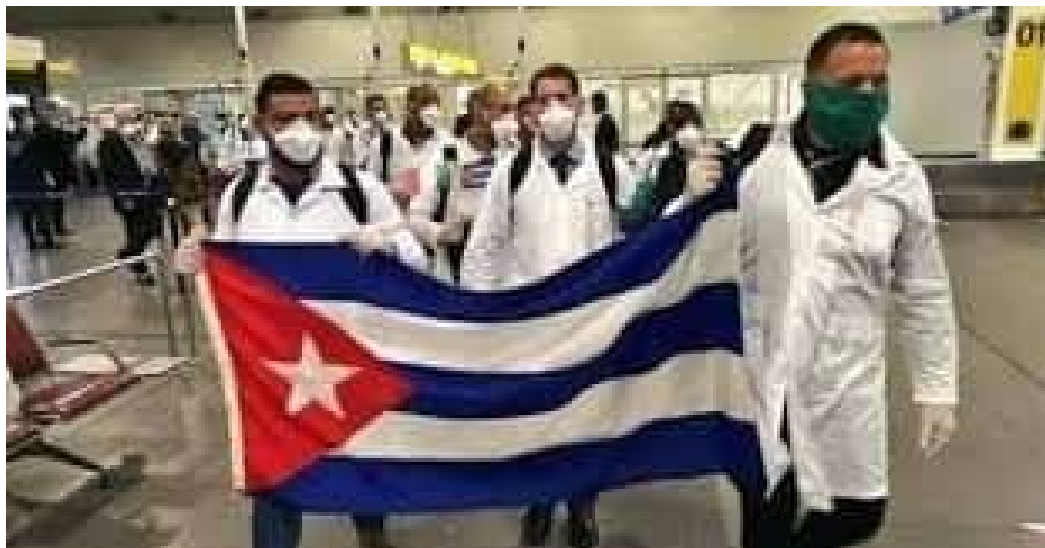
Brigada Henry Reeve, grandeza que contagia

Anda con su capa blanca limpiando el mundo y devolviendo salud, por eso sus manos producen magia y sus labios diseminan la esperanza por el mundo.