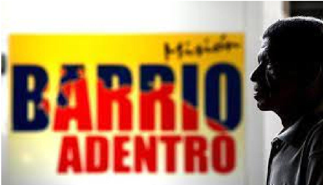
La colaboración médica entre Cuba y Venezuela

convenio de colaboración entre ambas naciones, naciendo para bien de los más necesitados la Misión Barrio Adentro Salud.