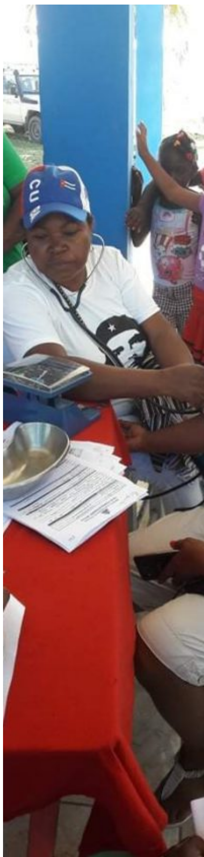
Digna representante de la mujer cubana