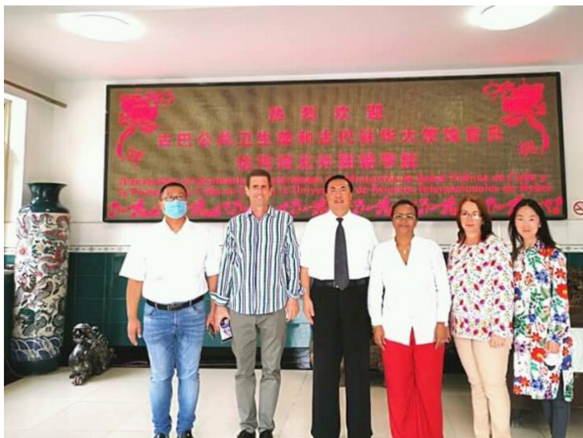
A nombre del Embajador de la República de Cuba en China, Carlos Miguel