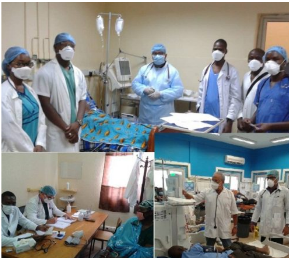
Una historia noble de solidaridad