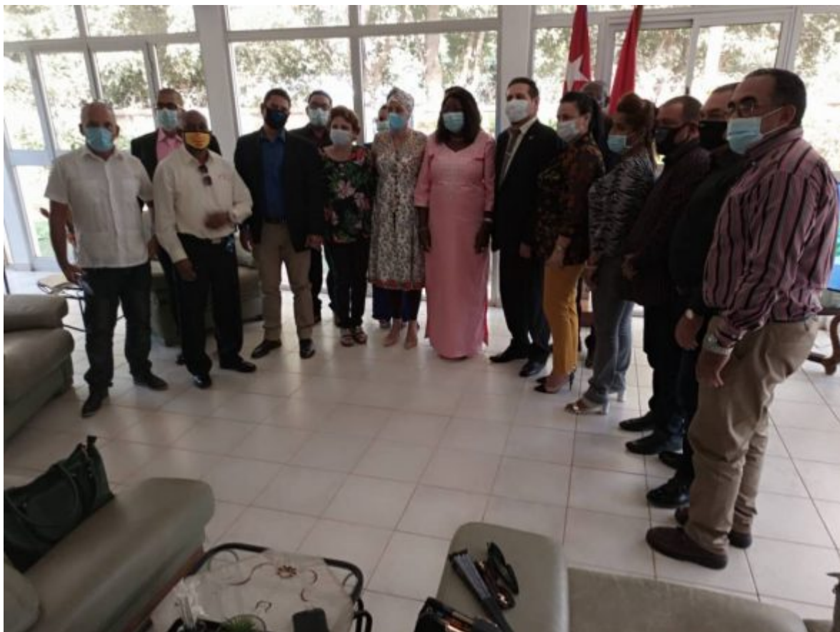
Colegas Burkines y Cubanos