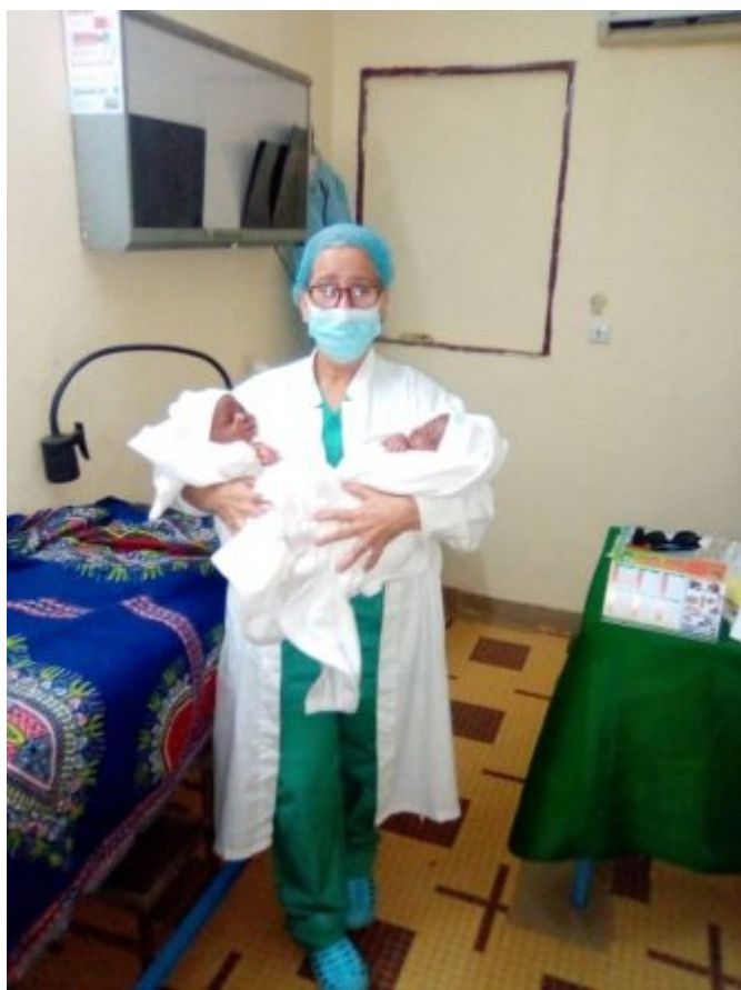
Pareja de gemelos traídos a la luz

Con extraordinaria experiencia en la contribución de brigadas solidarias en el continente y una profesional consagrada a su especialidad y a la salud materna e infantil, también comparte con el Dr. Frómeta las actividades asistenciales y quirúrgicas con el pueblo burkinabes. En las instantáneas.