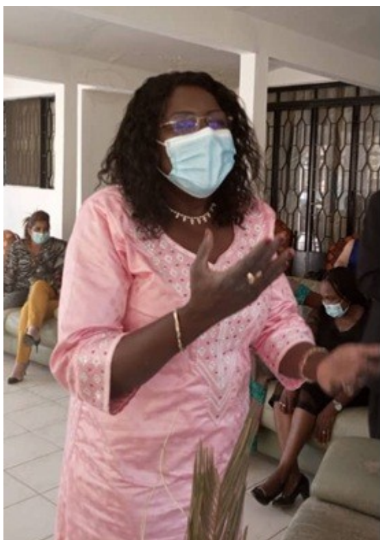
La Ministra de Salud de Burkina Faso, reconocimiento