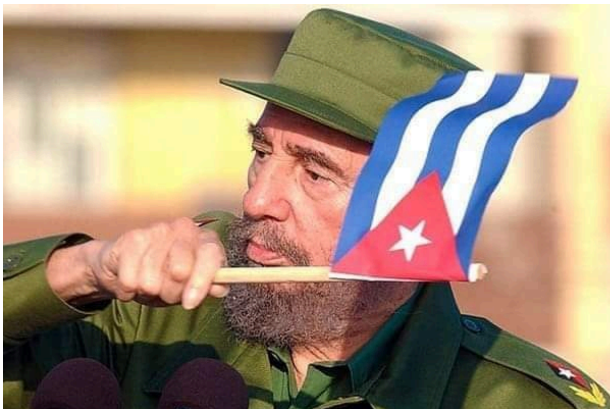
Querido Fidel Castro

Este hombre de mirada profunda concibió los programas económicos, científicos y sociales más audaces que puedan ser imaginados: dar tierra a los campesinos, enseñar a los analfabetos, ofrecer trabajo a los obreros, esperanza a los jóvenes, dignidad a la mujer, salud a todos. Nunca se sabrá, cuánto hay de Fidel, de su talento, carácter, enseñanzas y su entrega en nuestra capacidad de resistencia, porque no existe manera de medirlo.