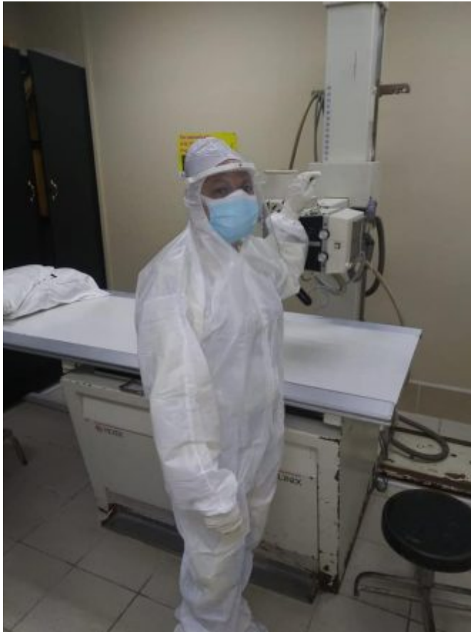
Cumpliendo misión en la región norte de Belice

Hace 125 años Roentgen hizo el hallazgo y con ello obtuvo el primer Premio Nobel de Física en 1901.