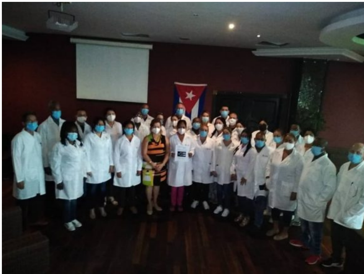
Arribaron profesionales cubanos a nuestro hermano pueblo Belice

Fidel como un formidable comunicador social, en su autodefensa en el juicio por las acciones del cuartel Moncada; denunció la situación sanitaria que había en Cuba cuando dijo: (...)”Cuatrocientas mil familias del campo y la ciudad viven hacinadas, sin la más elemental de las condiciones de higiene y salud (...) El noventa por ciento de los niños del campo esta devorado por parásitos (...) El acceso a los hospitales del estado siempre repletos, solo es posible acceder a ellos mediante la recomendación de un magnate político que le exigirá al desdichado su voto” (2).