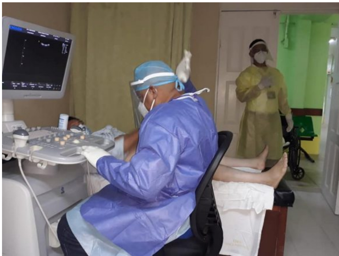
Cumpliendo misión en la región norte de Belice

La OMS recordó los aportes del físico alemán Wilhelm C. Roentgen; Descubrió el 8 de noviembre de 1895 los rayos X; se elige esta jornada cada año para celebrar la fecha.