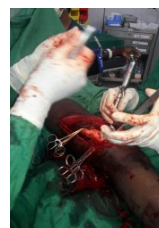
Intervención quirúrgica por colaboradores cubanos en Haití