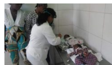
Trabajo integrado donde se funden la asistencia con la labor educativa y profiláctica