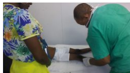
Colaborador del laboratorio orto prótesis, Bon Repos, departamento Oeste