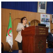
Brigada del Hospital Oftalmológico Amistad "Argelia-Cuba" del oued

DESDE LA BRIGADA MÉDICA CUBANA DE ARGELIA APOYAMOS LA DECISIÓN DEL #MINSAP Y CONDENAMOS LA POSTURA DE @JAIRBOLSONARO DE CUESTIONAR LA DIGNIDAD DE LOS #MÉDICOSCUBANOS QUE PRESTAN SU SERVICIO AL PUEBLO BRASILEÑO. #CUBA, #SOMOSCONTINUIDAD, #YOSOYFIDEL, #55INTERNACIONALISMOFIDELISTA