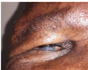
Catarata ocular derecha, Eswatini 2019