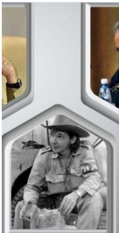
A Raúl Castro en su 90 cumpleaños