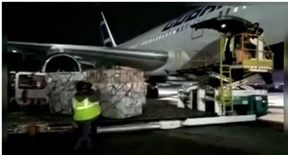
Donativo de jeringuillas para Cuba