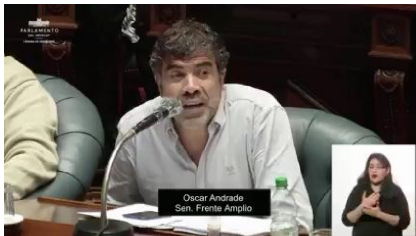
Senador Oscar Andrade, Parlamento del Uruguay

También, agradece en su intervención, a la cooperación médica cubana y a sus profesionales, y recuerda que gracias a ellos; miles de uruguayos y muchos más en el mundo, han recuperado la visión, y que en Cuba se han formado como médicos, 500 uruguayos procedentes de familias pobres, acotó.