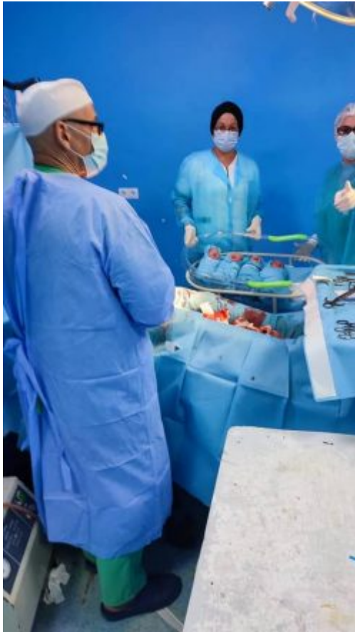
Equipo que realizó esta proeza.