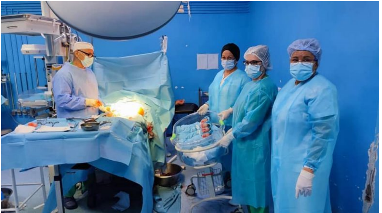
Orgullosos muestran a los cuatrillizos.

Cuando nacen estos cuatrillizos, se observa el trabajo del equipo multidisciplinario de colaboradores de la Salud que hay detrás, que por cierto no termina, pues siguen acompañando a estos bebés, los