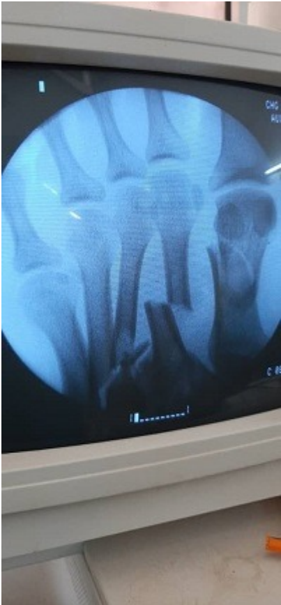
Antes de la operación