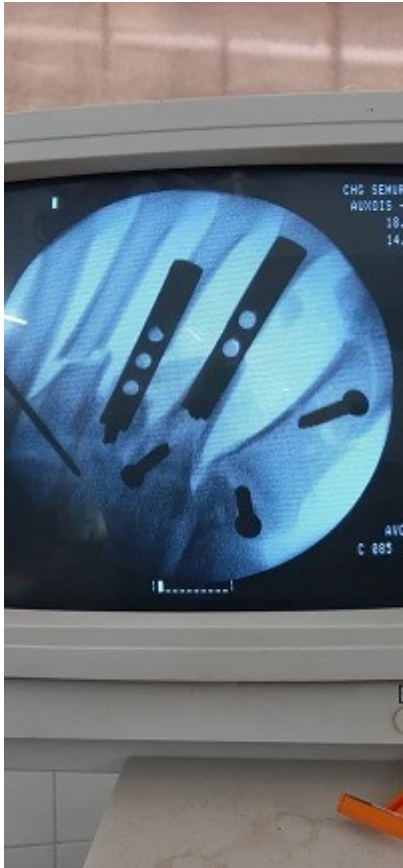
Después de la operación

El paciente se ha recuperado de forma satisfactoria, aunque por la gravedad de las lesiones mantenemos una vigilancia estricta. Salvar vida es nuestra meta, ya que sin desatender a nuestra población, llevamos la CubaPorLaSalud a todos los países que lo necesiten ya que contamos con un sistema de salud gratuito y resiliente , con un indicador de 9,0 médicos por cada mil habitantes que permite una cobertura al 100 % de la población.