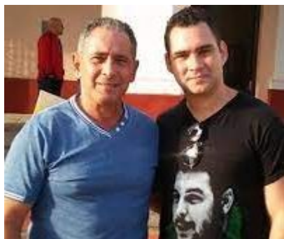
Elian González, 21 años de su regreso