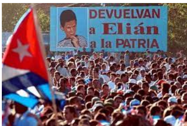
Batalla protagonizada por el pueblo cubano en solicitud de la devolución de Elian González

El 28 de junio del 2000, gracias a la lucha del pueblo cubano dirigido por su invicto líder, el Comandante en Jefe Fidel Castro, regresa el niño de seis años Elian González quien fuera secuestrado en Miami por familiares lejanos, luego de haber sido sacado ilegalmente de Cuba por su madre.