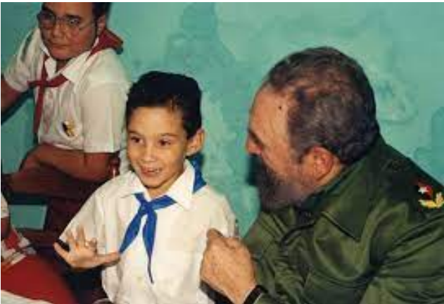
Elían González en Cuba junto al Comandante en Jefe Fidel Castro, máximo precursor de su regreso

21 años después de este regreso, Elían se ha convertido en un joven de 27 años, graduado de Ingeniería Industrial fruto de una victoria moral, humana y solidaria a favor del derecho de un niño a crecer y desarrollarse junto a su verdadera familia.