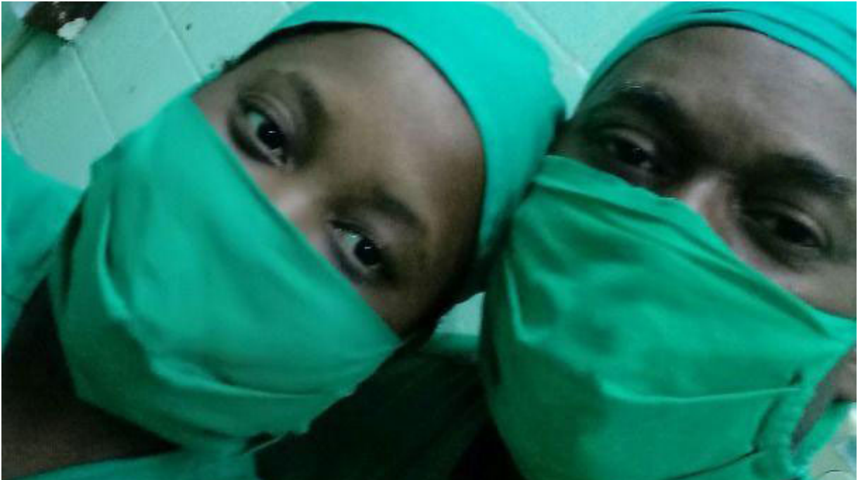
Esposa y compañera en las trincheras por salvar vidas

Justo rememora a la Agencia Cubana de Noticias, desde el otro lado del Atlántico y con cuatro horas de diferencia, la complejidad de aquellos años y los sacrificios para continuar la superación profesional, una posibilidad que defendió el país, pese al impacto del derrumbe del Campo Socialista y el recrudecimiento del bloqueo de Estados Unidos.