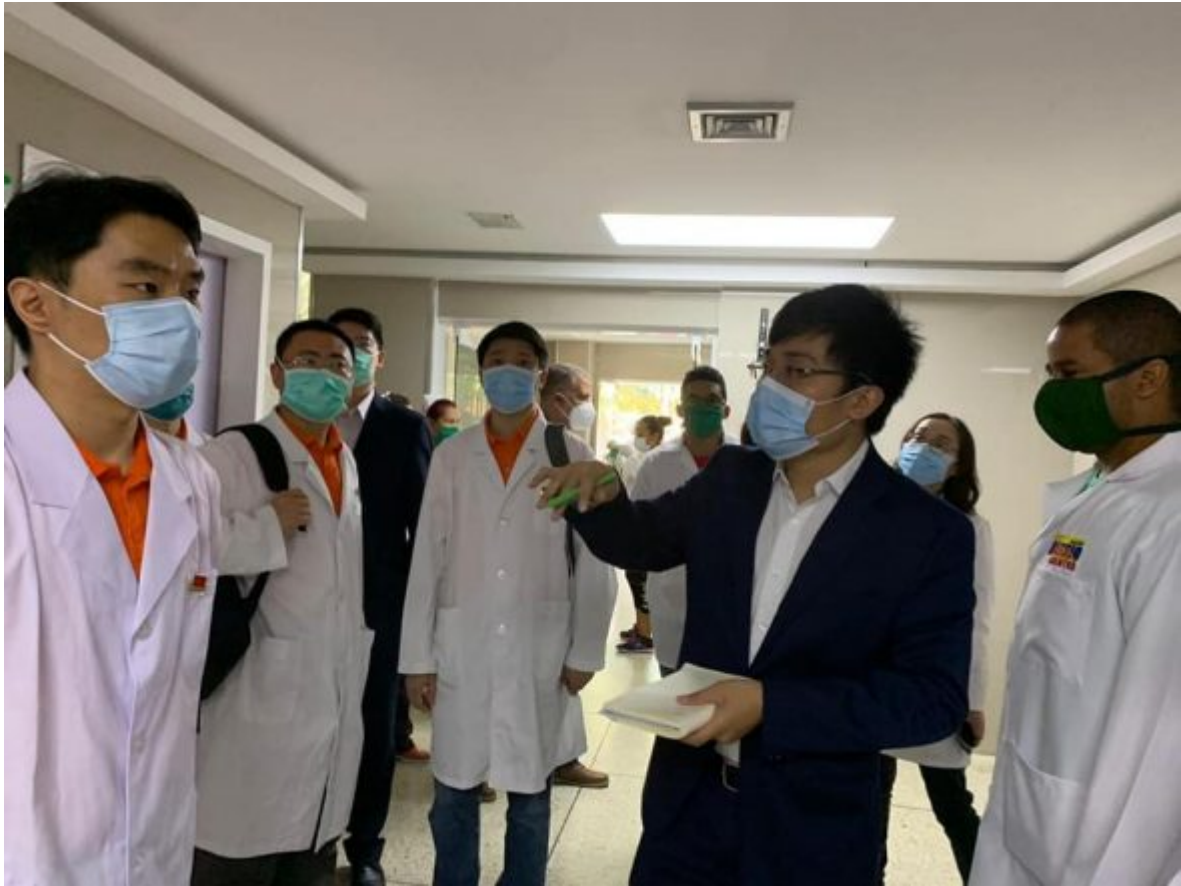
Personal de la salud cubano y venezolano, reciben a colegas chinos.