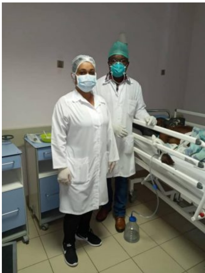
Medios de protección disponibles