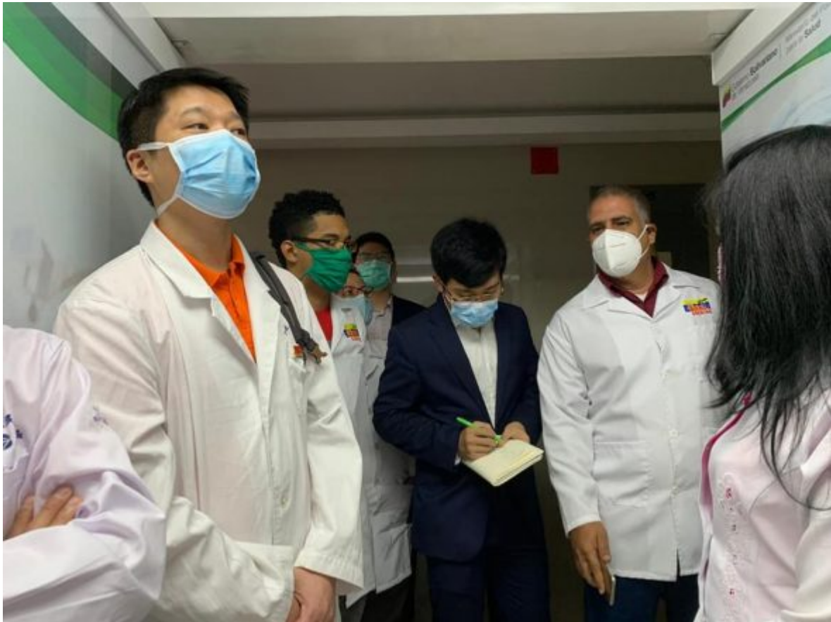
Personal de la salud cubano y venezolano, reciben a colegas chinos.

República Bolivariana de Venezuela hermanados por un bien común, fortalecer el trabajo de enfrentamiento al COVID-19. Se intensifican las acciones de capacitación al personal y se comprueban los aseguramientos para la atención con calidad a los pacientes siempre con la consigna que en la Unión está la Fuerza.