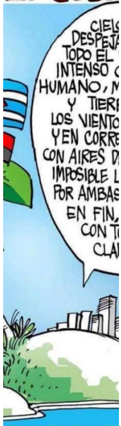
Estado del Tiempo en Cuba