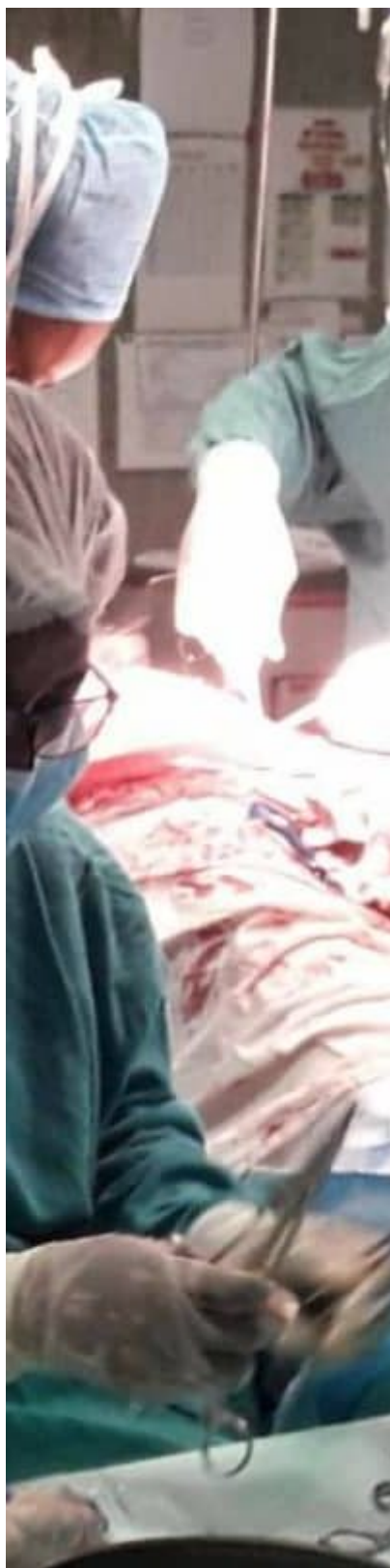
Brigada Médica Cubana en Namibia. Un Cirujano Plástico de altura.